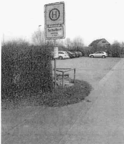
Foto Haltestelle im Bestand

Der Bereich ist eine Schotterfläche, die Nutzung ist primär ein PKW-Parkplatz. Der Ein- und Ausstieg der Schüler erfolgt relativ ungeordnet. Eine Abgrenzung der Aufenthalts-, Ein-, und Ausstiegsbereiche ist nicht vorhanden.