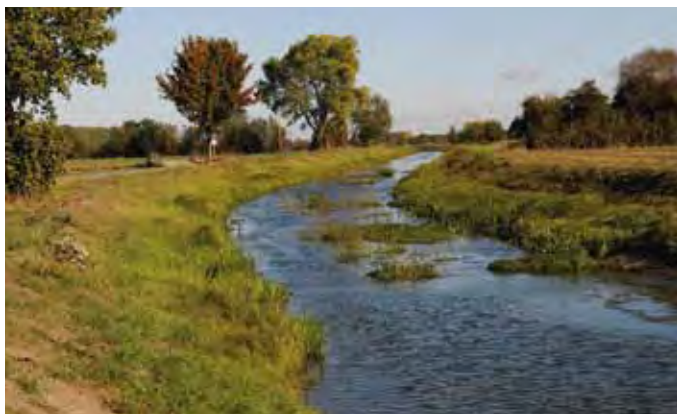
An der Eyter

Durch den Friedensvertrag von Celle 1679/81 wurden Emtinghausen und Bahlum zusammen mit den übrigen Ortschaften des Amtes Thedinghausen braunschweigisch.