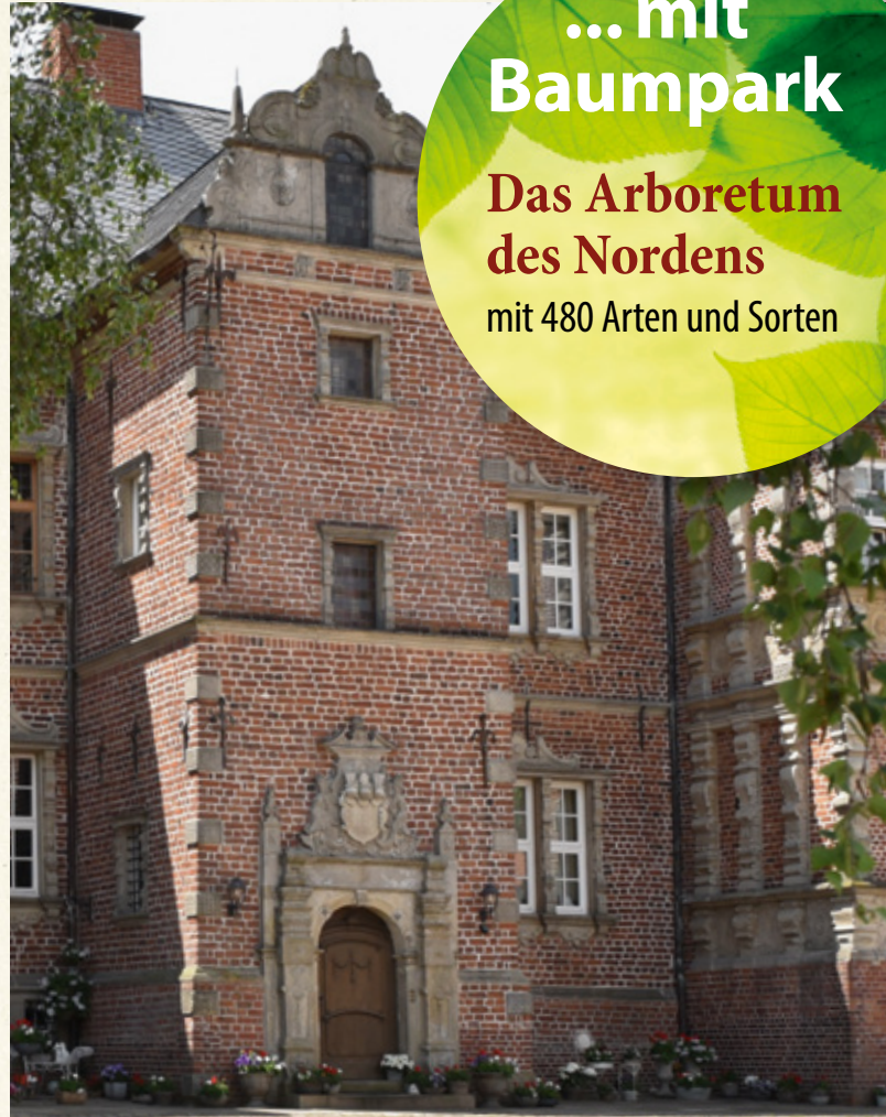
Gestaltung: Harald Hemmje, Fotos: Fritz Westermann H., Hemmje und andere, Stand: April 2026

Das Arboretum des Nordens mit 480 Arten und Sorten