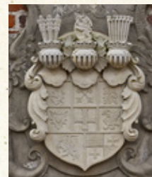
Das Wappen des Erbauers über dem Hauptportal des Schlosses Erbhof.

Zu den ständigen Angeboten für Besucher zählen eine Dauerausstellung über die Geschichte und Architektur des Erbhofes, das Heimatmuseum Thedinghausen und das 2016 eröffnete Restaurant Romance.