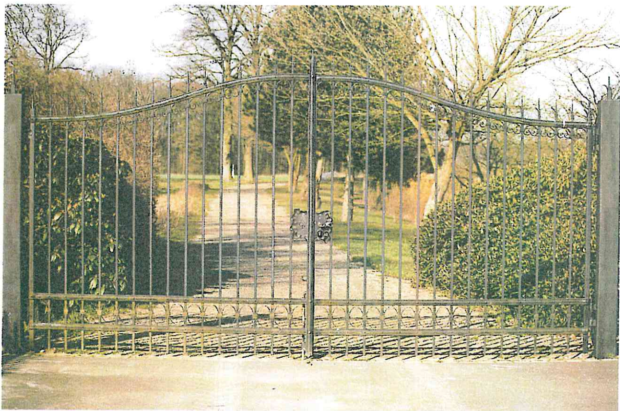
Schlosstor mit Staketen und Spitzen Haus Borg bei Münster