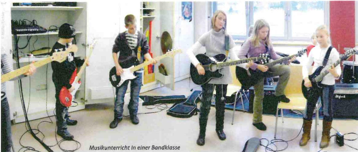
Musikunterricht in einer Bandklasse