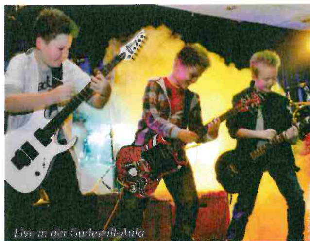
Live in der Gudewill-Aula

Der Laptop ist an die Musikanlage angestöpselt, und wir hören vor dem Spielen gemeinsam mit der Klasse in die Aufnahme rein. Die jungen Musiker sind gespannt bei der Sache. Die Aufnahme wird gestoppt. „Wo sind wir?“ Die Finger schnellen hoch. „2. Chorus“. „Richtig“. Der Song geht zu Ende.