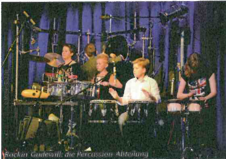
Rockin' Gudewill: die Percussion-Abteilung

„Los, aus jeder Instrumentengruppe einer.“ Die Disziplin lässt für eine Sekunde zu wünschen übrig, die Mikros sind in Windeseile besetzt und wir kommen durch den gesamten Chorus. „Stehkreis!“ Wir klopfen uns gegenseitig auf die Schultern. „Nächste Woche haben wir übrigens wieder Besuch: Die Uni Vechta kommt mit einem echten Professor.“ „Wie sieht der aus?“ „Einpacken!“ – Es klingelt.